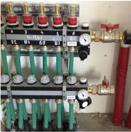
De leidingen liggen