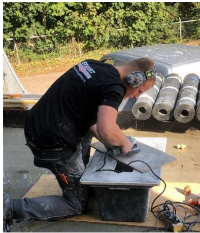
De tegels werden gesneden